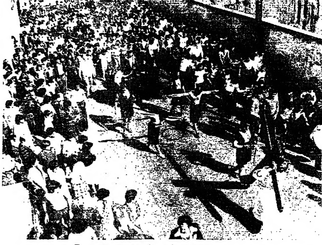
الموكب الحزين يهتف فرحا وسرورا في شوارع الارنوار...